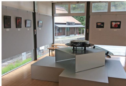
ギャラリースペース