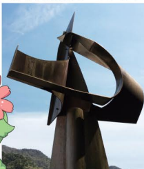
切上り長兵衛モニュメント